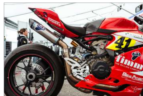
La Ducati Panigale del team Grandi Corse.